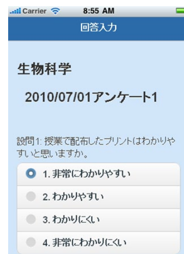
回答画面イメージ